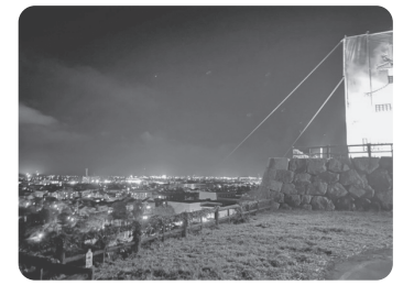
お城まつり仮設三階櫓設置