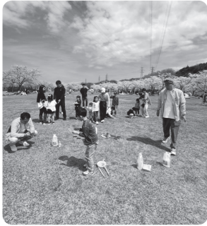
シャボン玉で地域住民と交流している様子