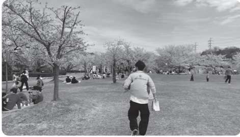
チラシを配る会員の様子