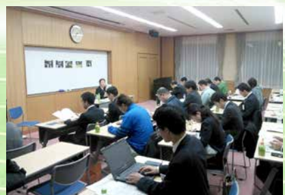
● 行政の担当者をお招きした障がい者雇用の勉強会

その一方、街づくりのリーダーとして、地方中核都市にふさわしい県都・鳥取の実現に向けて、新しい視点から多くの研究、提言を行っています。地元地域、鳥取YEGのさらなる発展のためには、もっともっと新しいエネルギーが必要です。大志を抱き、情熱あふれる皆様のご入会を心より歓迎いたします。