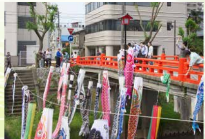
● 袋川鯉のぼり撤去作業