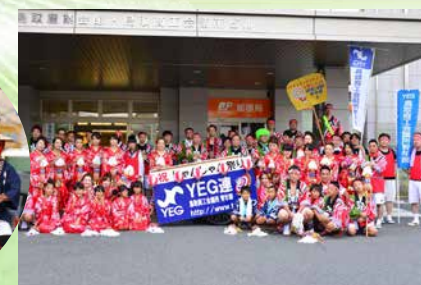
● 鳥取しゃんしゃん祭りへの参加