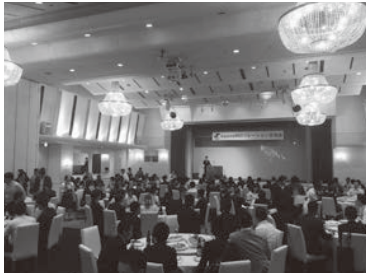
R53リレーション交流会の様子

来年度のR-53リレーション交流会は鳥取YEGが主幹となり、鳥取市で開催します。これまでの岡山・津山YEGに負けない交流会となるよう、これから一年間しっかりと準備をしてまいります。