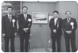
サンドピクチャー贈呈の様子