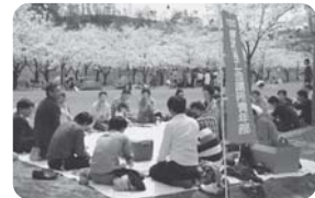
満開の桜の下での食事会