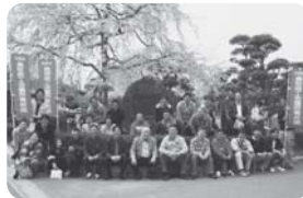
花見交流会に参加したメンバー