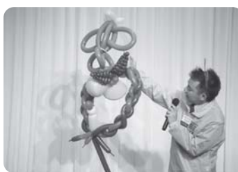
素敵なバルーンアート