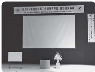
開場前のステージ